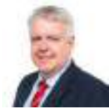
Carwyn Jones AS Llafur Cymru