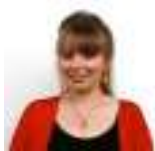
Delyth Jewell AS Plaid Cymru

Roedd yr Aelod a ganlyn hefyd yn aelod o'r Pwyllgor yn ystod yr ymchwiliad hwn.