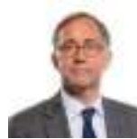
David Melding AS Ceidwadwyr Cymreig

Roedd yr Aelod a ganlyn hefyd yn aelod o'r Pwyllgor yn ystod yr ymchwiliad hwn.