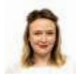
Bethan Sayed AS Plaid Cymru