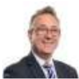
Mick Antoniw AS Llafur Cymru