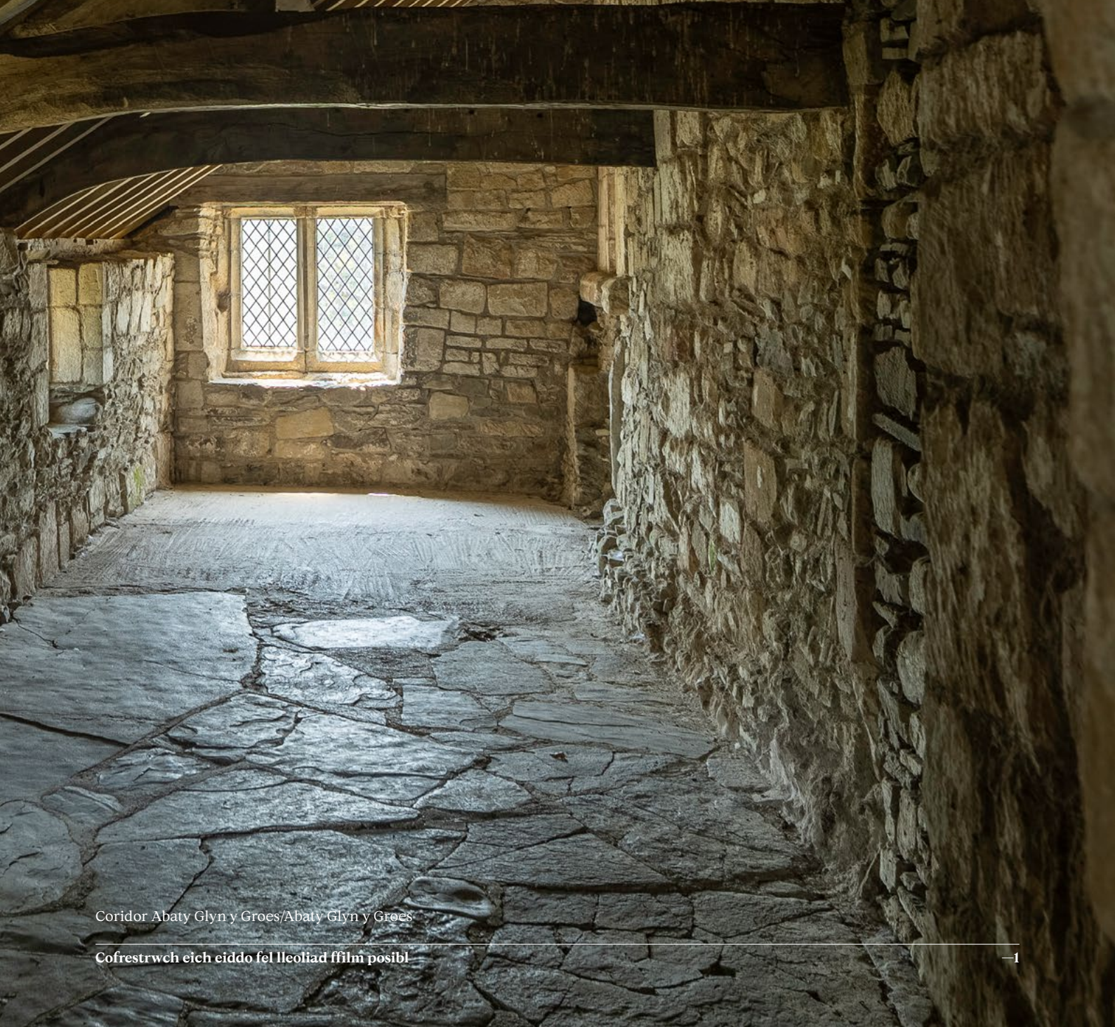
Coridor Abaty Glyn y Groes/Abaty Glyn y Groes

Mae Sgrîn Cymru, gwasanaeth cefnogi cynhyrchu Cymru gyfan yn rhan o dîm Cymru Greadigol. Mae ein harbenigwyr yn cynnig cefnogaeth ymarferol a rhad ac am ddim i bob math o gynyrchiadau ffilm a theledu ledled Cymru. Rydym wedi cynorthwyo miloedd o gynyrchiadau yn y gorffennol, o sioeau teledu poblogaidd fel Sex Education , Doctor Who a Sherlock i ffilmiau nodwedd mawr fel Harry Potter and the Deathly Hallows a Snow White and the Huntsman .