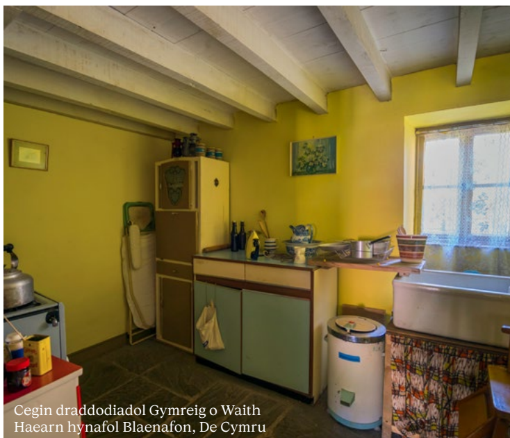
Cegin draddodiadol Gymreig o Waith Haearn hynafol Blaenafon, De Cymru