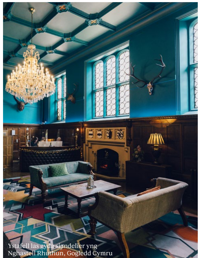
Ystafell las gyda siandelier yng Nghastell Rhuthun, Gogledd Cymru