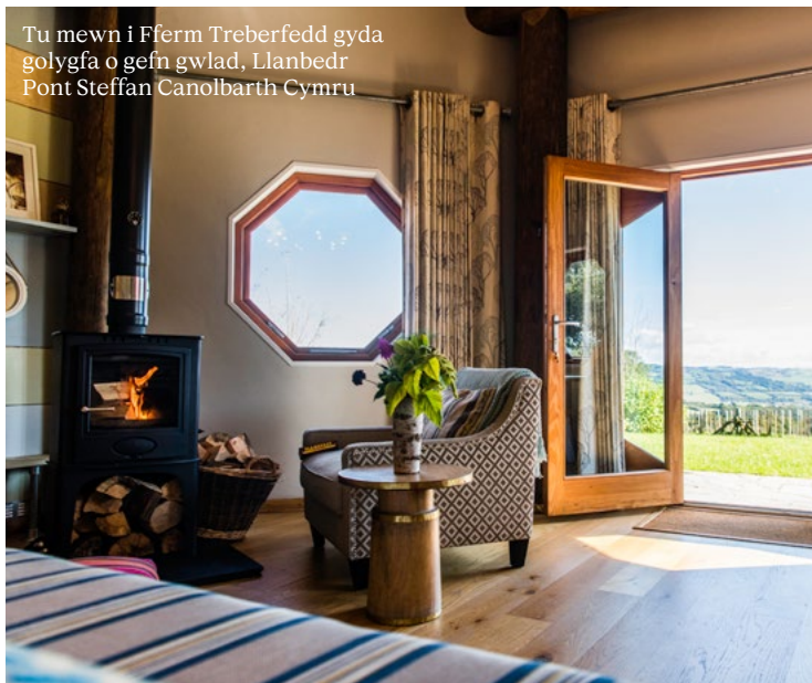
Tu mewn i Fferm Treberfedd gyda golygfa o gefn gwlad, Llanbedr Pont Steffan Canolbarth Cymru

Os na allwch dynnu lluniau, rhowch wybod i ni ac efallai y byddwn yn gallu trefnu amser cyfleus i ymweld er mwyn i ni gymryd ein lluniau ni.