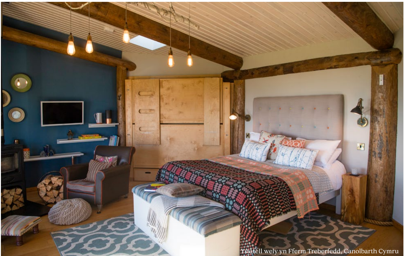
Ystafell wely yn Fferm Treberfedd, Canolbarth Cymru

Yn amlwg mae yna bethau ymarferol i'w hystyried; Mae hyd yn oed criwiau bach angen lle i weithio ynddo felly po fwyaf eich ystafelloedd y gorau. Fodd bynnag, peidiwch â digalonni os oes gennych eiddo llai, yn aml gall y rhain barhau i weithio ar gyfer lluniau llonydd neu hysbysebion. Gall parcio fod yn fater allweddol. Bydd angen lle gerllaw ar y cynhyrchiad i barcio eu cerbydau er mwyn cael mynediad at offer (goleuadau neu generaduron ac ati) a dydych chi ddim eisiau cythruddo eich cymdogion!