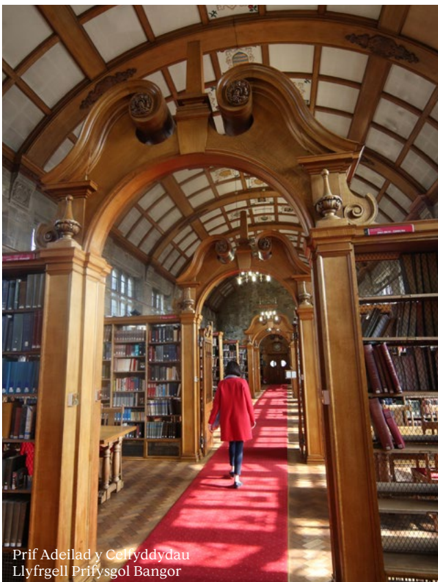
Prif Adeilad y Celydyddau Llyfrgell Prifysgol Bangor

Gall cynhyrchiad achosi tarfu ond yn y pen draw mae'n brofiad cadarnhaol i berchennog lleoliad, does dim byd gwell na gweld eich eiddo ar y sgrin.