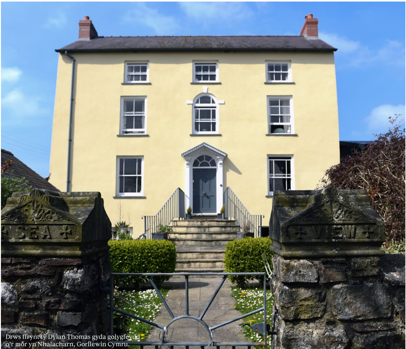
Drws ffrynt ty Dylan Thomas gyda golygfeydd o'r môr yn Nhalacharn, Gorllewin Cymru.

Mae hwn yn gwestiwn anodd i'w ateb. Yn y gorffennol rydym wedi ymateb i gannoedd o ymholiadau ac wedi paru cwmnïau cynhyrchu â llawer o safleoedd lleol. Mae cwmnïau ffilm a theledu ar leoliad drwy gydol y flwyddyn yng Nghymru. Er na allwn warantu y bydd eich eiddo yn cael ei ddefnyddio; unwaith y bydd gennym eich manylion, gallwn wneud y mwyaf o'ch cyfleoedd. Peidiwch â phoeni os nad ydych yn clywed gennym am amser hir, mae eich manylion gyda ni yn aros i gael eu "darganfod"!